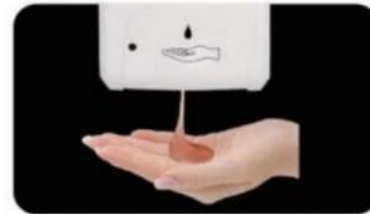
Liquide avec capteur (utiliser savon ou du gel désinfectant sans rinçage)