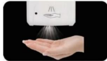
Spray avec capteur (utiliser désinfectant ou alcool)