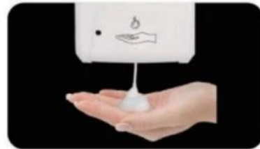
Mousse avec capteur (utiliser savon moussant)