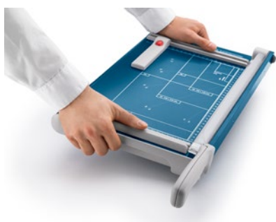
Des poignées concaves pratiques