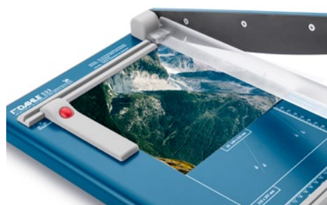
Rogneuse Dahle 533 - Cisaille à levier compact pour les loisirs et pour débuter