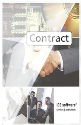
Finition mate en face, transparent à l'arrière