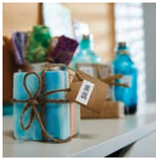
Vente au détail