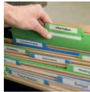
Fichiers et dossiers