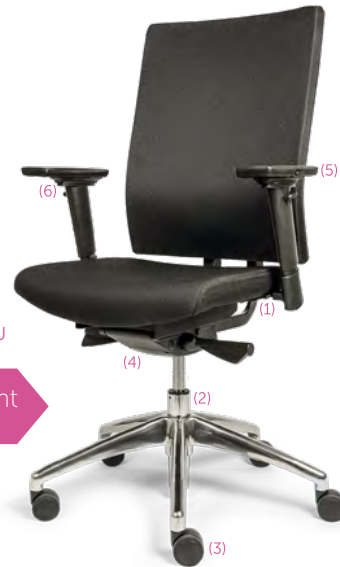
DOSSIER TISSU RÉF 802000