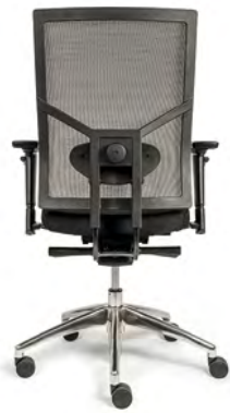
DOSSIER RÉSILLE RÉF 802003

Les bases de cette collection de sièges de bureau : design intemporel et confort abordable. La combinaison de l'aspect industriel épuré et du confort ergonomique fait de ces sièges un régal pour les yeux.